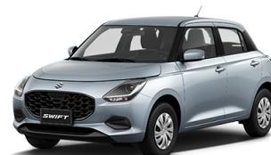
PLATA METÁLICO PERLADO