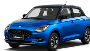
AZUL METÁLICO TECHO NEGRO