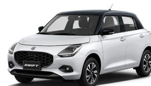
BLANCO PERLA TECHO NEGRO