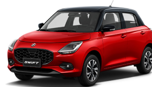
ROJO TECHO NEGRO